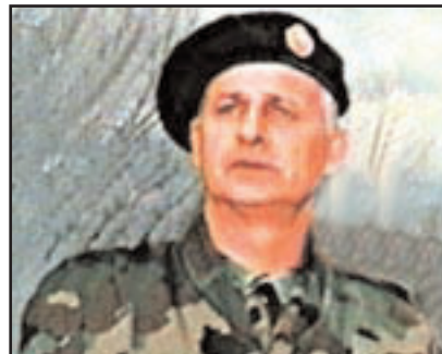
Генерал Радисав Крстић