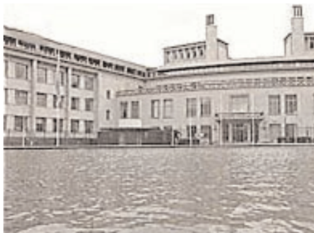
Зграда затвора у Хагу

Глас Конгреса • Serbian Unity Congress Herald , Београд