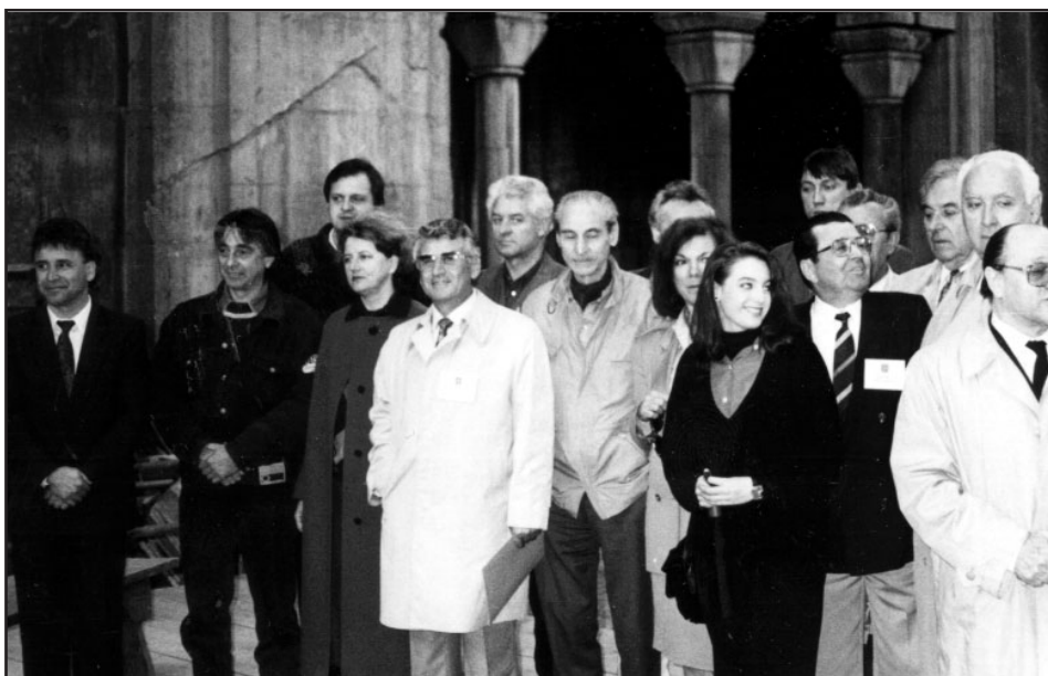
Део КСУ Мисије добре воље испред Патријаршије, 1991. године

процес транзиције, Конгрес српског уједињења је изашао са врло јасним пројектом названим План Феникс. У мају 1991. године, у Ју-