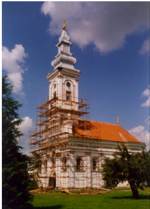
Црква у Мионици, 2001.